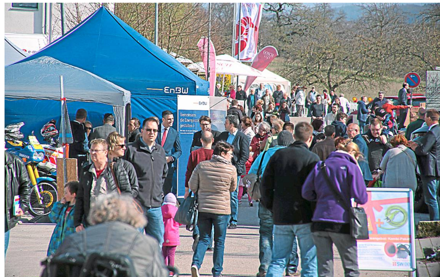
Die Veranstalter hoffen auf viele Besucherinnen und Besucher.